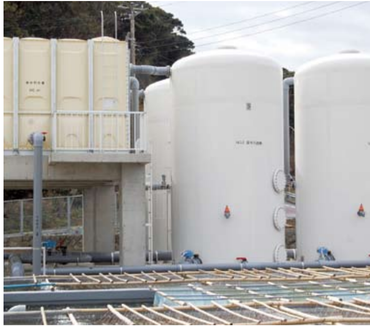
終了した修復工事、完成したろ過・貯水施設

安定しており、東京湾内に放流されて資源の維持に貢献してきま... 苗が供給できるのは小型サイズまでであり、放流効果が期待できる大型種苗の生産については、ろ過した海水を供給する能力に限界があり、安定した生産ができませんでした。また、既設