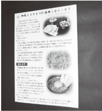
大好評のシラスレシピ

「チリメンジャコ飯」、量いわずなら「しらす酒」など三十三の作り方、食べ方を提案しています。シラス船曳網漁業者は、相模湾に面した場所に加工場を持ち、漁獲して帰港すると直ちに生向け、加工向けに選別し最良の鮮度で製品化しています。そして、主要道路沿いなどの直販所でシラス製品を販売しています。 それぞれの販売所でレシピを掲示していたところ、消費者の要望が多かったため「かながわブランド販売促進支援事業」を活用し、三万三千部のレシピを作り配布することにしました。