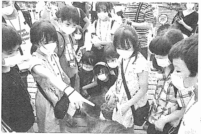
①稚魚を放流する参加者＝横浜市金沢区 ②東京湾で採取された生き物を見る参加した小中学生ら＝横浜・八景島シーパラダイス